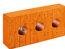
Mauerziegel ÖF 3-loch