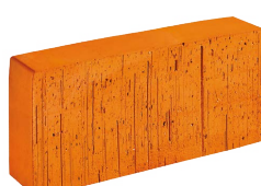
Mauerziegel ÖF voll